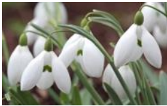
Schneeglöckchen, Blütezeit Januar-Februar, Höhe 10 bis 20 cm

Tipp : Es empfiehlt sich, mehrere Zwiebeln pro Pflanzloch zu setzen, um während der nächsten Blüte eine optisch imposantere Wirkung zu erzielen.