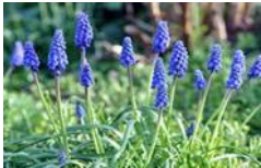
Traubenhyazinthen (Muscaris), Blüte März bis Mai, Höhe 15 bis 20 cm