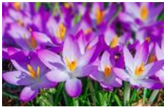
Krokusse, Blütezeit Februar bis Mai, Höhe 15 cm