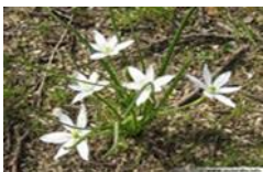
Milchstern (Ornithogalum), von April bis Mai, Höhe 50 cm