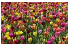
Tulpen, Blütezeit März bis Juni, Höhe 50 bis 60 cm