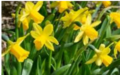
Narzissen (Ouschterblummen), Blütezeit Februar bis Mai, Höhe 10 bis 60 cm